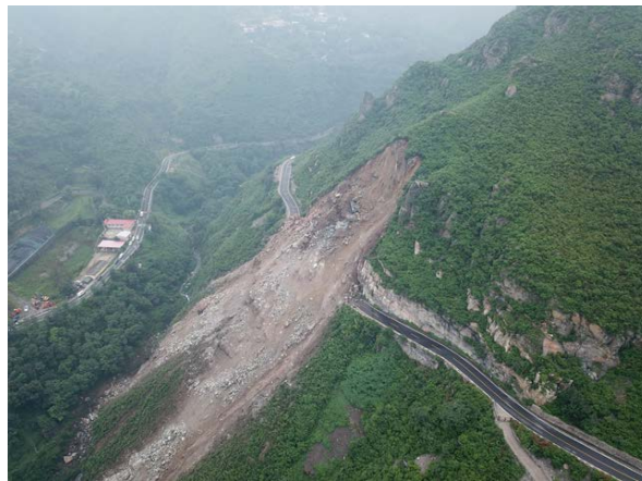
山体崩塌地质灾害现场

发生塌方后，北京市交通委及公路分局会同区政府、乡政府和国土部门进行应急处置。8 月 18 日，通过公路抢险人员昼夜抢修施工，安装交通安保设施，完成了临时绕行路线抢通工作。2019 年 8 月份全面完成修复工作。