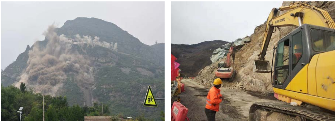
山体崩塌地质灾害防治工程

2018年8月18日，公路抢险人员昼夜抢修施工，完成了临时绕行路线抢通工作。8月23日，国土部门出具了地质灾害调查报告，公路分局委托勘察设计单位组织力量，开展前期勘察设计和专家论证工作。8月27日，设计单位完成初步治理方案，决定采取爆破方式处置山体存在的危岩。8月29日，北京市交通委议定按照抢通和恢复重建两个阶段对该处塌方点进行治理。9月13日上午圆满完成山体爆破工作。10月30日，完成了塌方路段大体积危石破碎、清理、路基挡墙修复、交通防护设施安装等工作，恢复临时通车。2019年8月份全面完工。