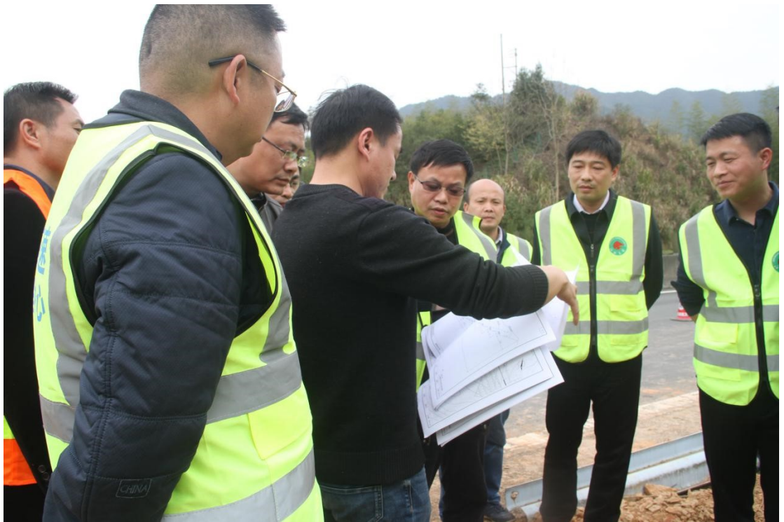
山体滑移地质灾害现场处置