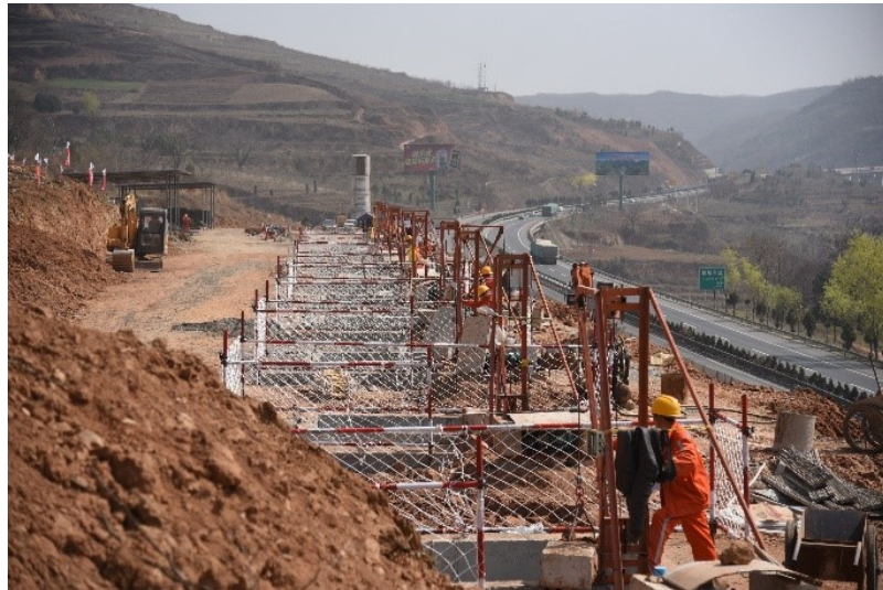
治理工程实施场景

2013年6至7月份,甘肃省天水境内连续强降雨引发G30连霍高速公路宝天段部分路段发生山体滑坡、泥石流、边坡坍塌等灾害,加之2013年7月22日岷县、漳县6.6级地震导致K1347+600-K1349+000段内右侧山体三处大型滑坡,造成路基推移、路面隆起,严重危及道路和行车安全。