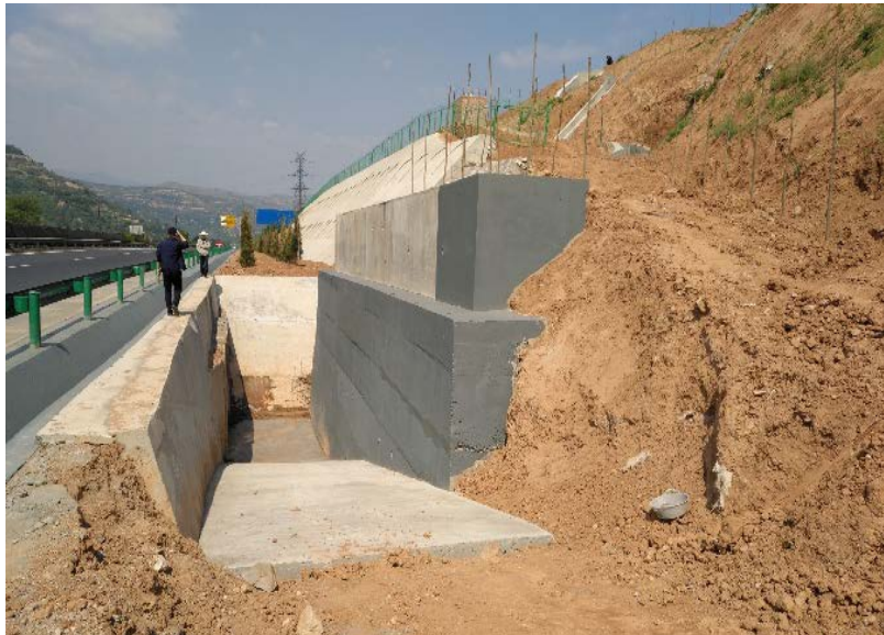
治理工程沿线构造物

上述路段滑坡处治项目路段全长 2.35km，处治方案为：削方减载+抗滑桩+反压+截排水+边坡防护及植被绿化的综合处治。实施过程中，地方政府、公路养护、收费管理和高速交警部门联合制定了应急预案，就滑坡地质灾害应急救援的范围，滑坡地质灾害应急救援启动的范围，领导组织机构，各部门的工作职责及协调配合等方面做了详细明确。