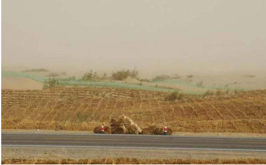
沙漠公路沙害防治工程实施后