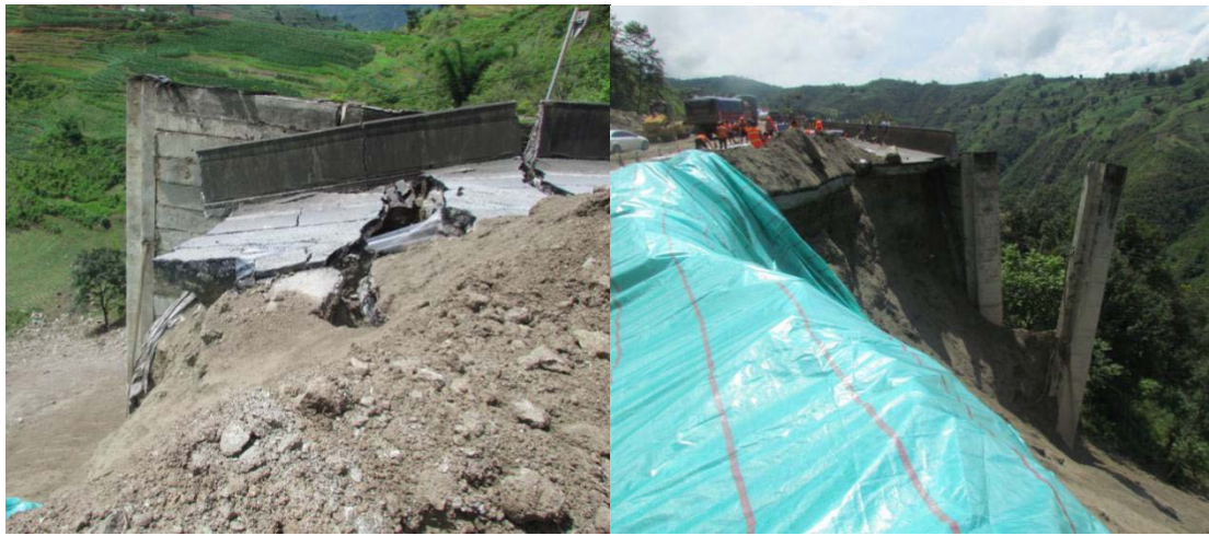
路基开裂、沉陷，桩严重倾斜

据工程地质测绘，该滑坡位于澜沧江断裂南约400m处。滑坡周界较清晰，滑坡体平面形态呈“矩形”，滑坡后缘位于公路左侧，前缘位于山坡中段，滑坡体沿滑动方向最大长度60m，横向最大宽度46m，平面面积约2571.3m 2 ，平均厚度约6.6m，体积约16970.58m 3 ，属小型中层滑坡。