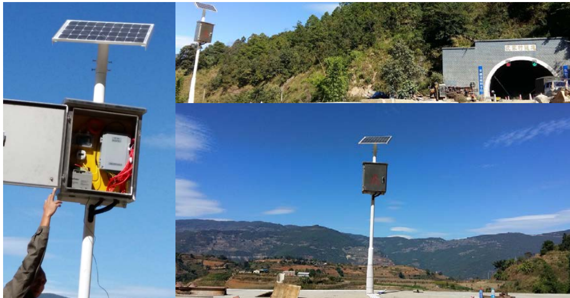
太阳能+无线传输实现长期性能监测